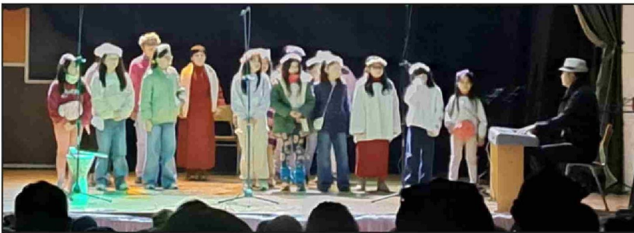
Un ambiente familiar envolvió al Teatro Roberto Barraza. En la foto, el Coro de Niños del IAC.