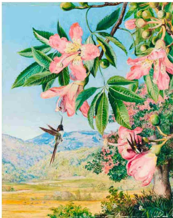
Ilustración naturalista de Marianne North