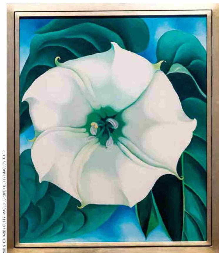
Georgia O'Keeffe. « Jimson Weed/White Flower N° 1 » (1932)

En su instalación « La vida secreta de las flores » (2018-2024), la argentina Julieta Tarraubella (1991) presenta la versión espectral del momento primaveral de las plantas. Un conjunto de pantallas y fotografías de pequeño formato registra el nacimiento y declinación del encanto de lirios y tulipanes en un circuito cerrado de cámaras, conformando una vista semi-científica, artificial y urbana, donde la Naturaleza es transformada en imagen digital. La obra muestra la realidad con un brillo incandescente de un instante archivado en los ceros y unos del lenguaje binario. Es una visión que combina la fibra del high tech que lo atraviesa todo en las ciudades modernas con el gesto amoroso de capturar con ternura e inocencia el reino de lo orgánico. 🌷