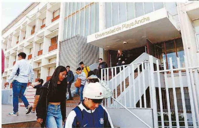
ENTRE ESTA Y LA PRÓXIMA SEMANA, LOS UNIVERSITARIOS COMENZARÁN SUS RESPECTIVAS CLASES.

En la Ciudad Jardín, en tanto, esto funciona en subida Los Lirios, lugar donde