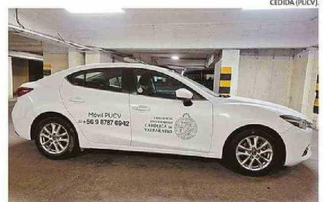
PUCV CONTARÁ CON MÓVILES DE SEGURIDAD EXCLUSIVOS.

En Playa Ancha, por su parte, la prioridad de la UPLA no solo está en proteger a sus alumnos de incivildades, sino que también protegerlos de la inseguridad vial que se registra en este sector: Esto a propósito del fatal ac-