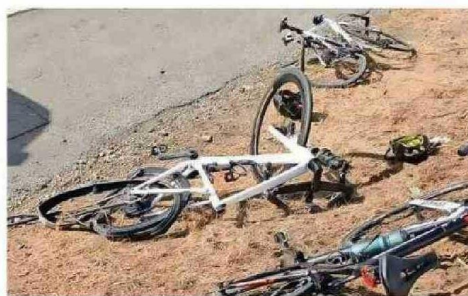
MOUAT IBA CON SU HIJO Y AMIGOS CIRCULANDO POR LA RUTA 5 SUR.

que se quedó dormido al volante: habían salido desde Santiago, en la noche, de vacaciones con rumbo al sur.