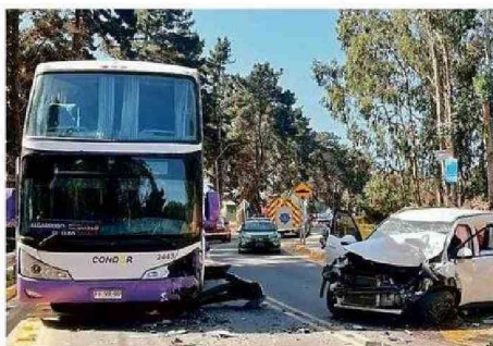
EL CHOQUE OCURRIÓ LA TARDE DEL DOMINGO EN EL QUISCO.

La colisión, de gran magnitud, causó que la lactante saliera eyectada del vehículo, cayendo a varios