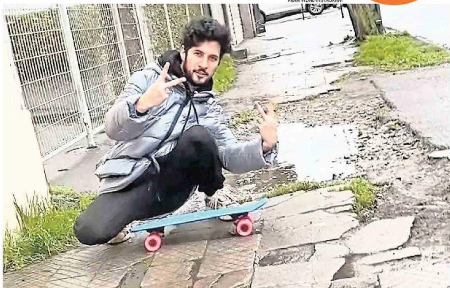
CON UN SKATE, EL PENQUISTA RECORRIÓ ALGUNAS CALLES DE CONCEPCIÓN, LAS CUALES NO TIENEN ARREGLOS HACE MUCHO TIEMPO.

“Un día iba en dirección de mi casa a un supermercado y le dije a mi polola: ¿cómo lo harán las personas que tienen alguna discapacidad o movilidad re-