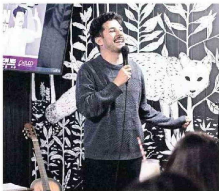
EL STANDAPERO SE LUCE CON LOS VIDEOS EN REDES SOCIALES.

ducida para transitar por acá? Esto porque se habla mucho de Conce como ciudad inclusiva u otros eslógans que se intentan levantar acá, pero la verdad es que estamos súper lejos de eso”, comentó.