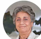
Jessica López, ministra de Obras Públicas.

El ministro Juan Carlos Muñoz destaca uno de los proyectos de ese paquete: la ampliación de la Ruta 9, que conecta Punta Arenas con la Ruta 255-CH. Explica que se trata de un proyecto prioritario