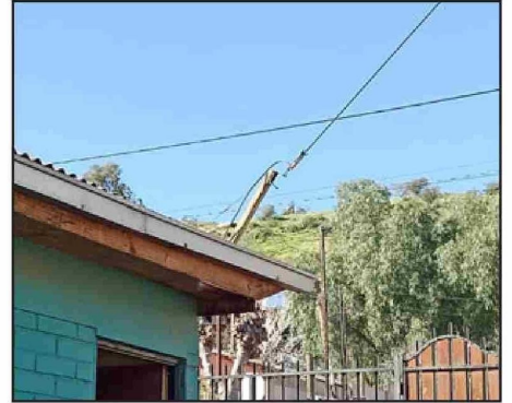
Así se ve desde un domicilio, lo inclinado que está el poste.