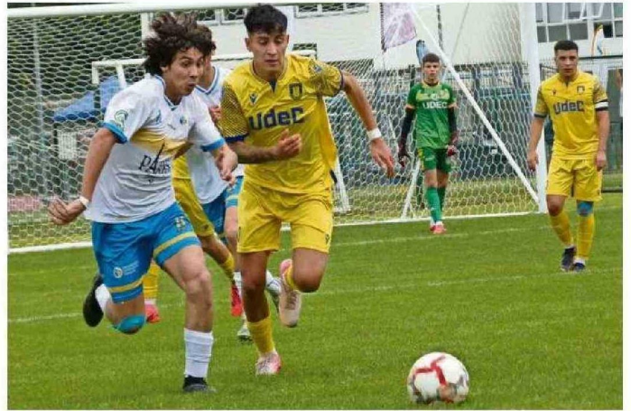
TRES ENCUENTROS DISPUTÓ LA UNIVERSIDAD CATÓLICA DE TEMUCO EN EL CAMPEONATO NACIONAL.