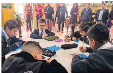
SE APLICA A ESCOLARES DE PRIMERO A CUARTO BÁSICO.

¿Qué es el Mantel de Palabras? En un juego educativo para todas las familias, creado por el Ministerio de Educación, que comprende de una especie de tablero cuya idea es que estudiantes de 2do a 4to Básico, y sobre todo las familias puedan participar para desarrollar las habilidades del lenguaje en instancias cotidianas, intercambiando historias reales y ficticias, cultivar la imaginación, despertar el apetito de conocer palabras.