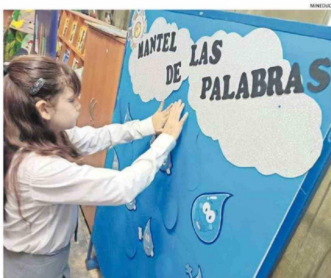
ESTA HERRAMIENTA YA SE ENCUENTRA DESDE JUNIO EN TODAS LAS ESCUELAS PÚBLICAS LA REGIÓN.