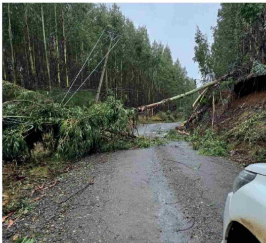
VECINOS DEL SECTOR piden a empresa de Frontel que pueda restablecer la electricidad lo antes posible.

Además dijo que durante el fin de semana estuvieron con la compañía distribuidora analizando la situación: "Instruimos para que nos presentara un plan de recuperación del servicio, de manera de contar con el cien por ciento de los clientes con luz a la brevedad".