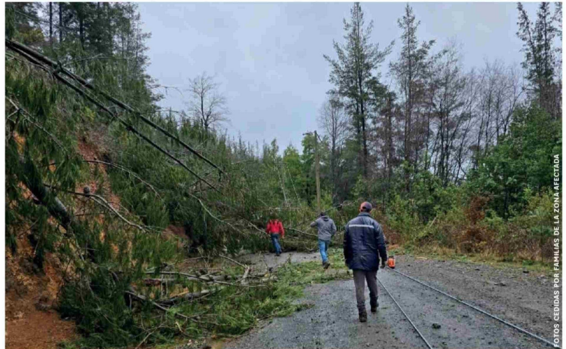
A CASI TRES SEMANAS aún hay familias de sectores rurales sin electricidad.

"Todo se perdió, y ahí está la desolación e incertidumbre de no saber si la empresa va a responder con algo no. La emer-