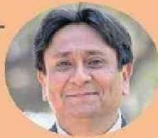
Gobernador Ricardo Díaz.

“Los fondos de litio tienen que estar orientados a generar futuras inversiones, cambiar la matriz económica de la región y permitir que hayan otros desarrollos económicos. Por ejemplo, el desarrollo del conocimiento científico a través de un apoyo directo al Instituto del Litio o también en el Instituto Aeroespacial”.