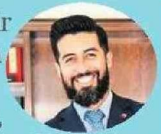
Exintendente Marco Antonio Díaz.

“El FNDR debiera seguir su ejecución priorizada según necesidades comunales. No obstante, los fondos del litio deben destinarse a un ambicioso plan de infraestructura regional que genere dinamismo en la economía local y que coloque a las pymes regionales y la contratación de mano de obra local en el centro”.