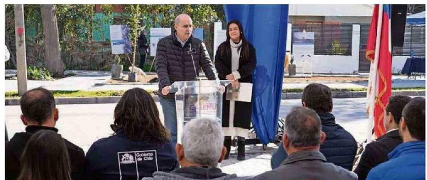
El gerente general de Fundación Chagres destacó el trabajo colaborativo que permitió concretar este proyecto.