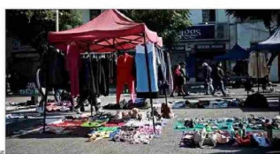
DERRUIDOS.— Sectores de la capital como Meiggs o la Vega Central se han deteriorado de la mano de la actividad informal.

Con distintos tipos de medidas, que van desde equipos de fiscalización hasta el aumento de permisos municipales, algunas autoridades han buscado enfrentar el fenómeno del comercio ambulante, que prolifera en barrios comerciales de las distintas ciudades.