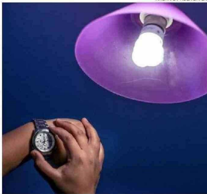
EL REGRESO AL HORARIO DE INVIERNO SERÁ EL SÁBADO 5 DE ABRIL.

La líder de esa multisindical enfatizó en los riesgos de sufrir trastornos del sueño. "Hay personas que les cuesta un mes adaptarse a un nuevo horario", aseveró, por lo que dijo estar de acuerdo.