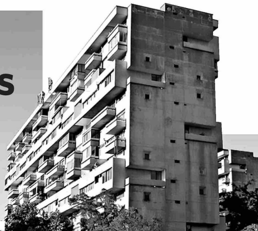
LA REMODELACIÓN República, construida en 1967, es parte del legado patrimonial capitalino.