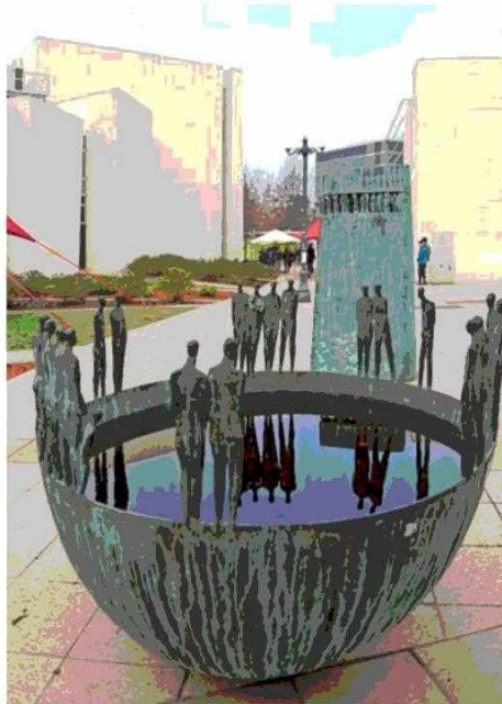
“Gran silencio”, de Mario Irarrázabal.