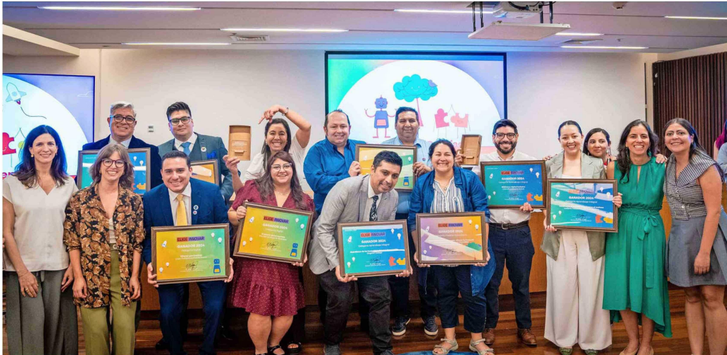
Durante la ceremonia se presentaron los 10 proyectos ganadores, divididos en tres categorías. Finalmente se destacaron tres.

EN SU QUINTA VERSIÓN, RECONOCIERON PROPUESTAS DE HUECHURABA, LA SERENA Y ALTO HOSPIICIO: