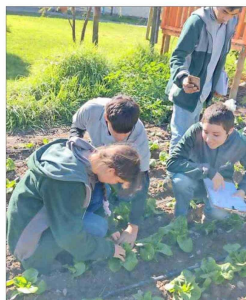
Las crisopas, un insecto de color verde, es la especie que eligieron para esta biofábrica de "insectos benéficos".

Destaca que durante el proceso, los estudiantes cumplen distintos roles: "Pasan de ser escritores a ser editores, a ser diseñadores gráficos y a ser programadores. Y el hecho de que estén trabajando en grupo también promueve la cooperación entre ellos y que cada uno cumpla un rol en ese grupo de trabajo".