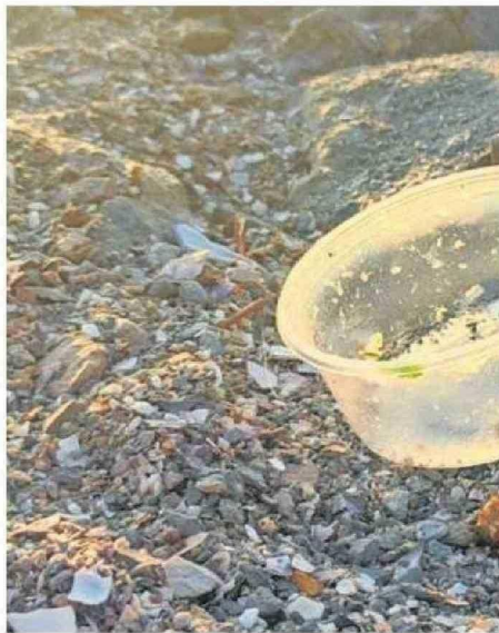
DESDE LA CORPORACIÓN COSTA CHINCHORRO LLAMARON AL PÚBLICO A COLABORAR PARA MANTENER EL SECTOR LIMPIO.

Visitantes han señalado que la falta de basureros suficientes y de inspectores municipales agrava esta situación, dejando en evidencia un problema de gestión en uno de los espacios públicos más concurridos de la ciudad. La ocupación no solo recae en el impacto estético, sino también en las consecuencias medioambientales. Muchos de estos residuos, arrastrados por el viento o las mareas, terminan contaminando el océano y