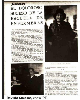
Revista Sucesos, enero 1931.