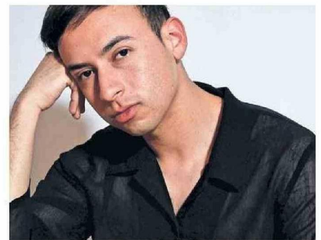
ACTUALMENTE VALLEJOS ESTÁ RADICADO EN SANTIAGO.

El taller "Explorando el movimiento: un viaje a través de la danza contemporánea" tiene por objetivo, explorar las posibilidades del movimiento y la expresión a través de la danza contemporánea, promoviendo la creatividad en los intérpretes escénicos, la conciencia corporal y la conexión con el propio cuerpo. Con una duración de dos horas cada clase y abierto a todos los niveles, se realizarán ejercicios como de movimiento continuo para desarrollar la fluidez y la continuación del movimiento. Se explorarán diferentes cualidades del movimiento, como la velocidad, la dirección y el peso, y se introducirán técnicas de danza contemporánea, incluyendo el release y el release aéreo. Además, se lle-