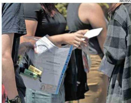
MILES DE ESTUDIANTES RENDIRÁN EL EXAMEN.

matemáticas (PAES M1). Para el docente, teniendo en cuenta que este lunes comienza a rendirse