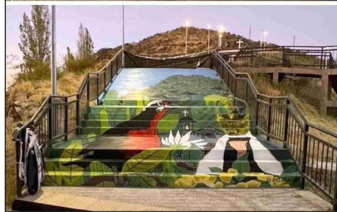
El antes y el después de la escalera con rampa que fue intervenida por el muralista.