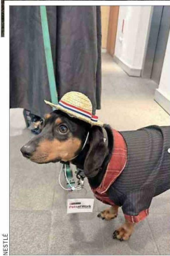
Toffee durante una celebración de Fiestas Patrias en las oficinas de Nestlé en Chile, donde trabaja su dueña.

sus mascotas al trabajo, una tendencia conocida como "oficinas pet friendly ". Tal es el caso de Google y Amazon en EE.UU., en donde los colaboradores pueden ir a trabajar con sus perros.