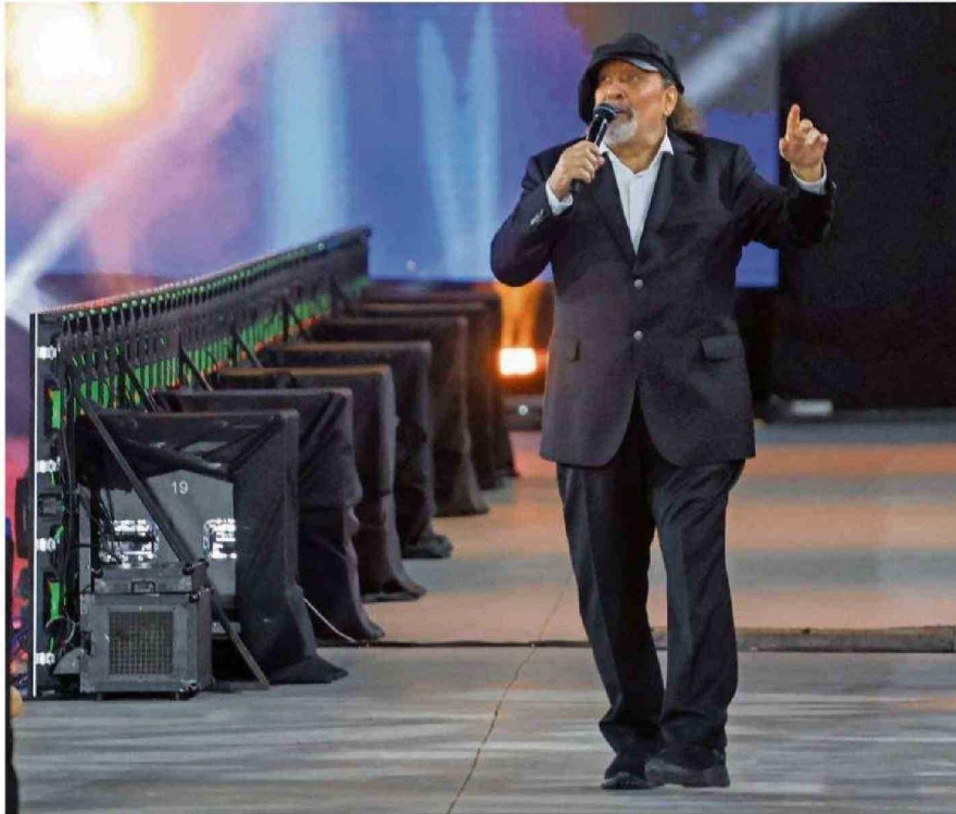
LA GALA DEL FESTIVAL DE VIÑA FUE LA ÚLTIMA APARICIÓN EN TELEVISIÓN DE MIGUEL PIÑERA LA SEMANA PASADA.

En palabras de él mismo, lo pasó "chanchito" en la Unidad Popular. A pesar de no ser alguien ligado a la política (tanto de izquierda como de dere-