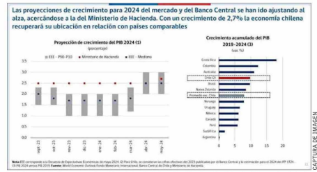
Las proyecciones de crecimiento para 2024 del mercado y del Banco Central se han ido ajustando al alza, acercándose a la del Ministerio de Hacienda. Con un crecimiento de 2,7% la economía chilena recuperará su ubicación en relación con países comparables

"Es cierto que la política fiscal se guía a partir de la regla del balance cíclicamente ajustado, el