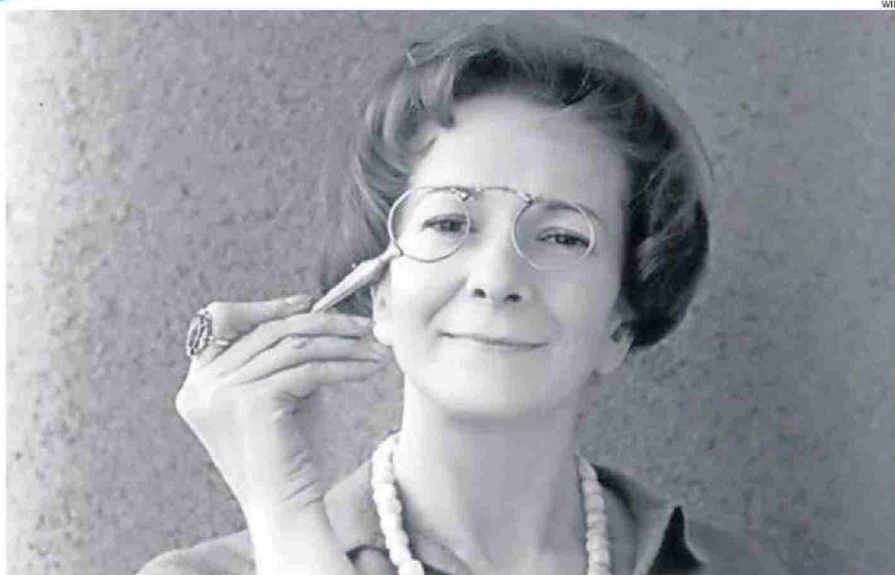
LA AUTORA RECIBIÓ EL PREMIO NOBEL DE LITERATURA EN 1996.

A remitentes con nombre y apellido aparecen respuestas como "lo que vamos a decir a continuación suena muy desmoralizador: es usted una persona demasiado franca y cándida para escribir bien. En las entrañas de un escritor con talento se arremolinan los más diversos demonios. E incluso si antes o después de escribir se encuentran adormecidos (o deberían encontrarse adormecidos), durante la escritura tienen una frenética actividad. Sin su ayuda, el escritor no podría adentrarse en las complicadas vivencias de sus personajes. Nada humano me es ajeno: ¡oh, esta sentencia no se puede aplicar a las vidas de los santos bondadosos!