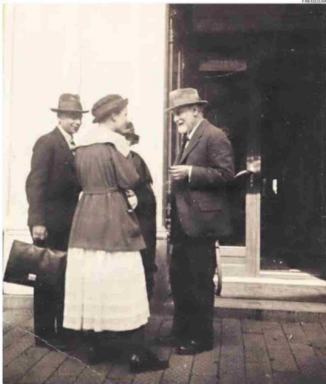
RANK FUE UN DISCÍPULO MUY CERCANO A FREUD, DE QUIEN SE TERMINÓ DISTANCIANDO.