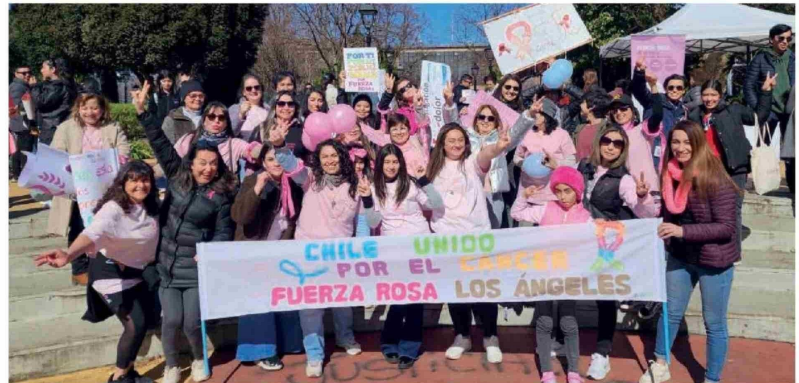
FAMILIAS DE DISTINTAS COMUNAS de la provincia participaron de la marcha nacional de prevención contra el cáncer.