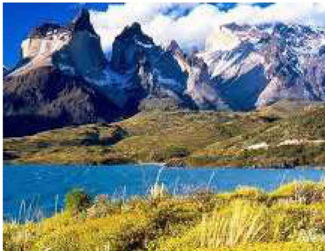
A contar de hoy la venta de entradas a los parques nacionales y áreas protegidas bajo administración de Conaf estará a cargo de Chiletour.

hasta hoy, 30 de agosto, operaríamos manualmente, para comenzar el 1 de septiembre con el nuevo módulo de tour operador, el cual vendrá mejorado y con las modificaciones solicitadas por los gremios. Sin embargo, seguimos a la espera y recalamos la necesidad de que se cumplan estos plazos. No podemos aceptar que lleguemos a enero de 2024 en las mismas condiciones. Es imprescindible que se nos informe y se nos guíe en los tiempos oportunos", comentó la gerente de HYST, Sara Adema.