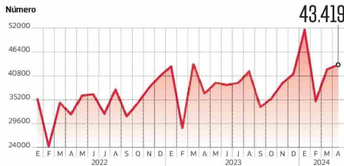
DESPIDOS POR NECESIDAD DE LA EMPRESA

Para los economistas, esta causal es la que más se relaciona con el ciclo económico, puesto que las firmas tienen que acreditar que no pueden mantener a ese trabajador o trabajadores por motivos económicos y, por