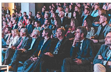
Una amplia convocatoria tuvo la inauguración del nuevo centro de Clínica MEDS.