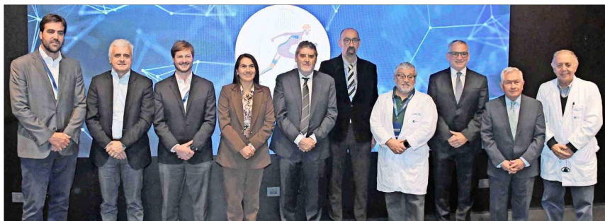
Autoridades académicas, institucionales, profesionales y prestadores de la salud fueron parte de la inauguración del Centro Noxis.

Tiraje: 126.654 Lectoria: 320.543 Favorabilidad: No Definida