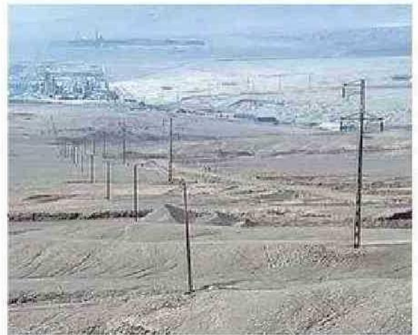
NUEVA AFECTACIÓN AL SUMINISTRO ELÉCTRICO.