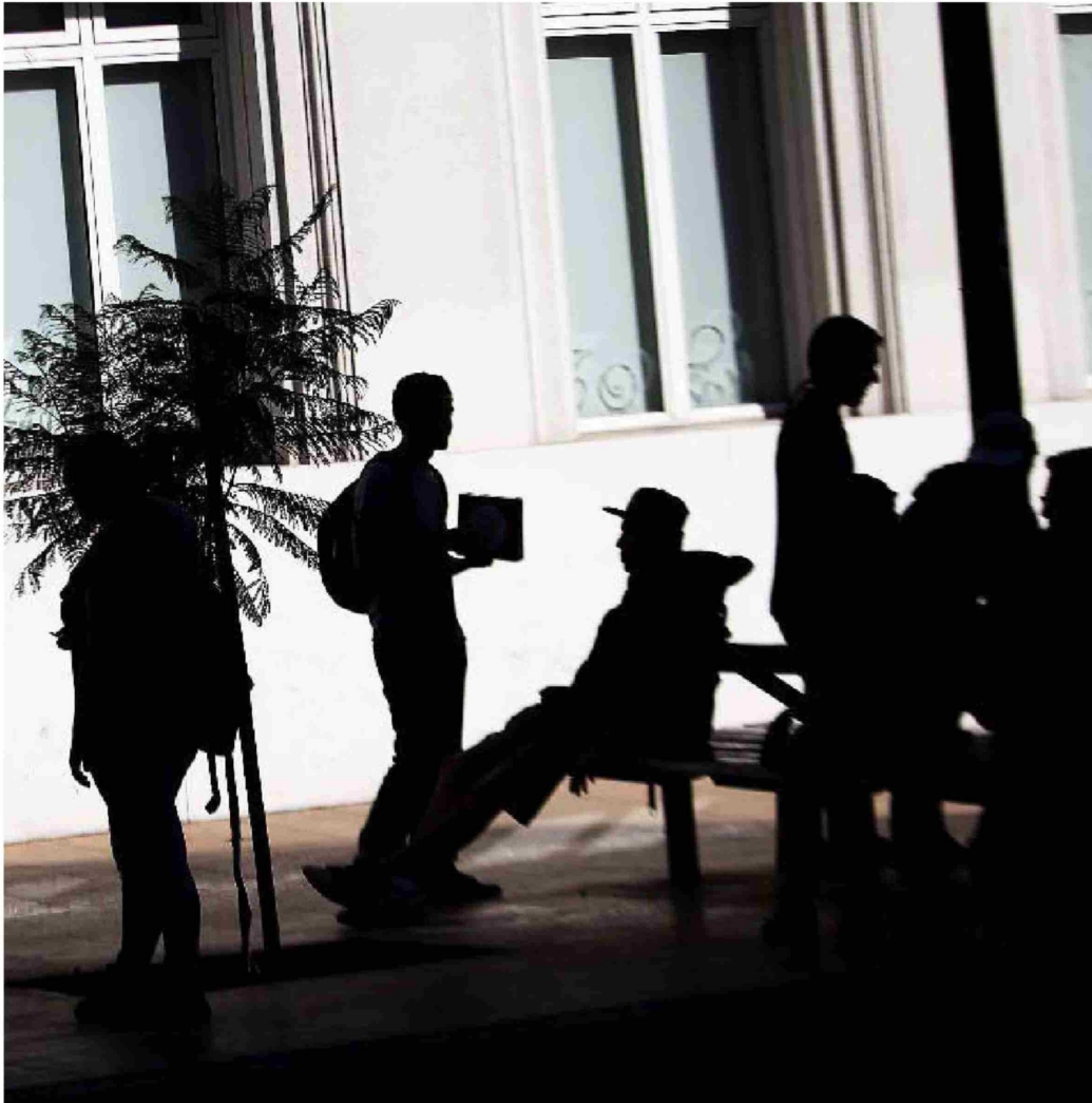
► Para realizar las denuncias se deberá crear un canal único y centralizado, de acuerdo a la nueva normativa.

te. "Ello implica, en primer término, reconocer la condición de aprendiz del practicante, quien se encuentra inmerso en un proceso de formación y, por lo tanto, su desempeño debe siempre estar subordinado a la vigilancia y acompañamiento de un tutor debidamente capacitado", se lee. A su vez, este reconocimiento implica que el estudiante, por su condición de tal, "se encuentra en una situación de vulnerabilidad frente a posibles situaciones de abuso o maltrato, tanto por su inexperiencia como por su dependencia directa de los tutores en el proceso formativo. En consecuencia, es fundamental que las instituciones de educación superior asuman la responsabilidad de proteger al estudiante de cualquier trato inapropiado o explotación, asegurando un entorno seguro y respetuoso que favorezca su aprendizaje y desarrollo profesional".