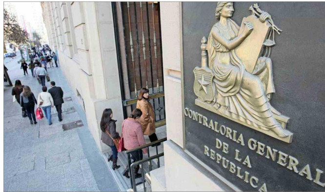
La Contraloría también informó que las municipalidades se financiaron principalmente con ingresos propios (23,2%) y transferencias desde el Gobierno central.

En tanto, el mejor desempeño fue el de BancoEstado, que tuvo utilidades por $695.113 millones. El resto de compañías del