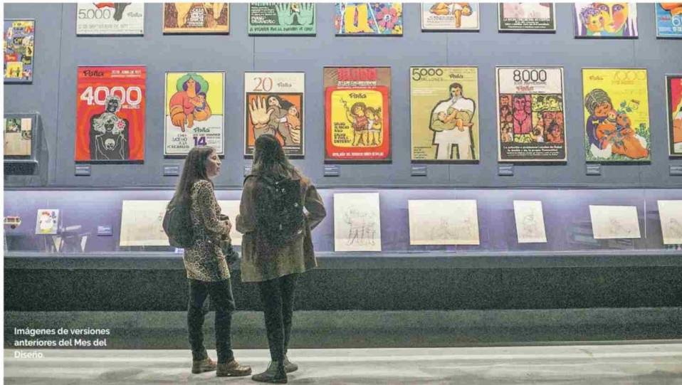
Imágenes de versiones anteriores del Mes del Diseño