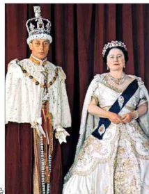
con los soviéticos. La monarca lo nombró "Caballero Comandante de la Real Orden Victoriana".