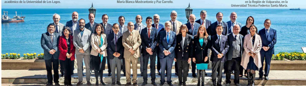
El Consejo de Rectoras y Rectores de las Universidades Chilenas (Cruch) tuvo sesión en la Región de Valparaíso, en la Universidad Técnica Federico Santa María.