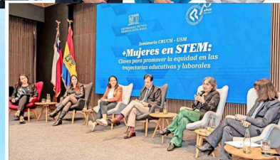
En el encuentro también se desarrolló el seminario "Mujeres en STEM: claves para promover la equidad en las trayectorias educativas y laborales".