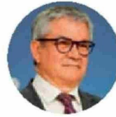
MARIO MARCEL, ministro de Hacienda

Hay que tener bastante prudencia para interpretar los datos de un mes y otro. Y así como con motivo de un mes que fue más bajo, no bajamos la proyección, ahora tampoco la vamos a incrementar”.