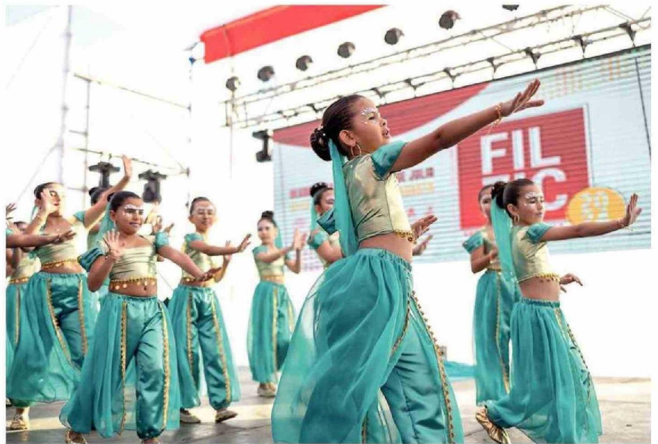
ESTUDIANTES DE LA CMDS SE LUCIERON CON LOS BAILES.