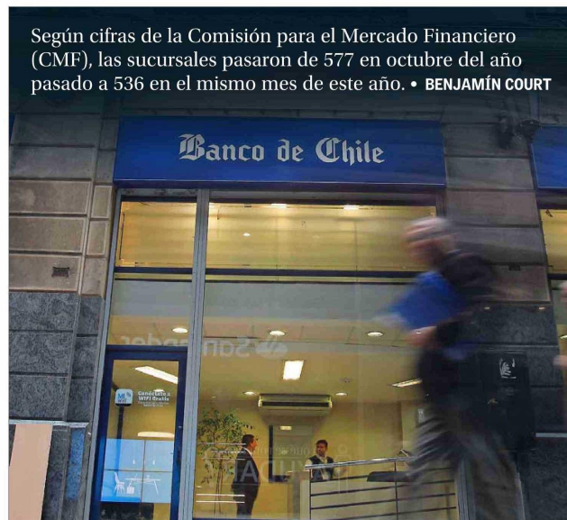
El Banco de Chile lidera la lista de cierres de sucursales durante 2023 y hasta octubre pasado.

mientos de los clientes, sin la necesidad de asistir presencialmente a una oficina.