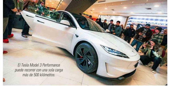
El Tesla Model 3 Performance puede recorrer con una sola carga más de 500 kilómetros.