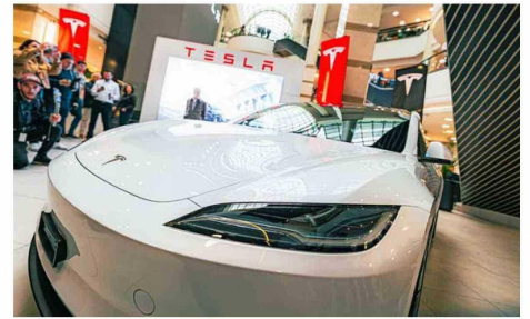
La electromovilidad ha crecido de forma exponencial en el país. De acuerdo a cifras de la ANAC, "las inscripciones de vehículos propulsados con tecnología de cero y bajas emisiones registraron un incremento de 106,4% durante el primer semestre de 2024".