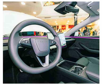
El nuevo modelo de Tesla tiene 460 caballos de fuerza y acelera de 0 a 100 km/h en tan solo 3,1 segundos.

Esta colaboración estratégica con Cenco Alto Las Condes no solo busca facilitar el acceso a los vehículos de Tesla, sino que también mejorará la experiencia de compra al ofrecer un servicio integral en un entorno cómodo y accesible. Desde el 7 de agosto, y de manera exclusiva, los clientes de Cenco Malls podrán hacer test drives en las instalaciones del centro comercial, para ello se debe agendar una prueba con Tesla en el mismo mall.