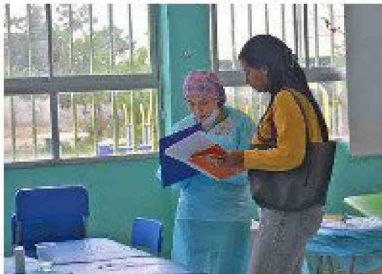
Más de 280 personas recibieron atención de salud en una jornada con especialistas y terapias complementarias.

E l pasado sábado, el Rotary Club Cachapoal, junto a otros clubes rotarios de la región y Santiago, llevó a cabo un exitoso Operativo Médico Interclubes en el Colegio Jean Piaget, ubicado en el sector poniente de la ciudad. La actividad, desarrollada entre las 10:00 y las 16:30 horas, ofreció atenciones gratuitas en diversas áreas de la salud a más de 280 personas.