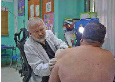
Rotarios realizan exitoso operativo médico gratuito en Rancagua.