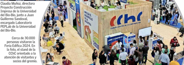
Cerca de 30.000 personas visitaron la Feria Edifica 2024. En la foto, el stand de la CChC orientado a la atención de visitantes y socios del gremio.