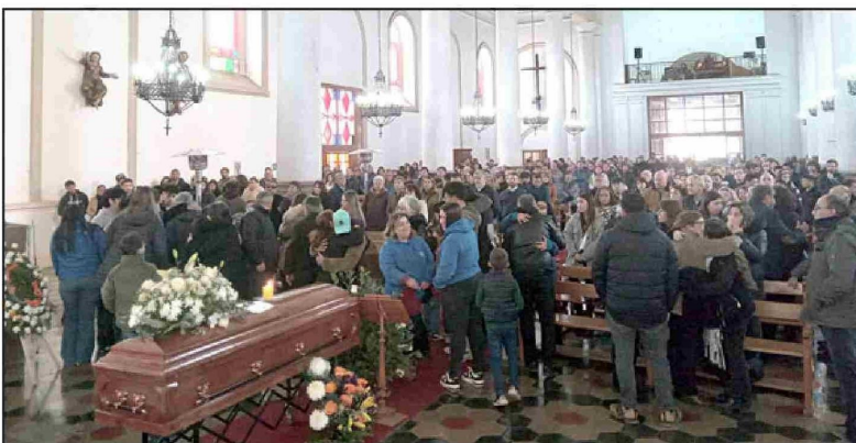
Los asistentes a la misa en el momento de la paz, en un lleno total del céntrico templo católico.