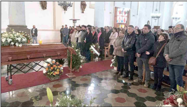
Familiares en primera fila este miércoles durante la misa en la Catedral de San Felipe.

- Todos los van a recordar como una gran persona, gran amigo y se ve reflejado por todos los que están acá.