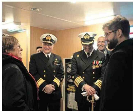
En la ceremonia participó la expresidenta Michelle Bachelet.

En esa línea, planteó que "es nuestra obligación como Estado contar con planes de largo aliento porque los desafíos del Siglo XXI nos obligan a ser previsores, las crisis climáticas, los cambiantes escenarios económicos y la geopolítica global nos exigen una vigilancia y un sentido de responsabilidad que no es sólo nacional porque proteger la Antártica es también proteger el futuro de la vida en nuestro planeta".