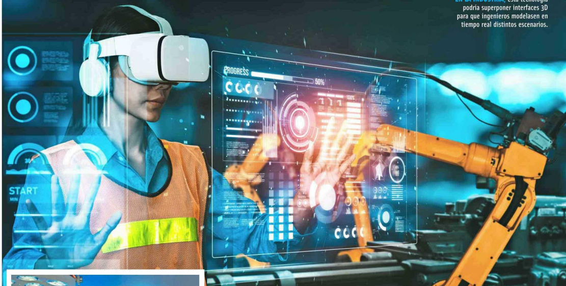
EN LA INDUSTRIA, esta tecnología podría superponer interfaces 3D para que ingenieros modelasen en tiempo real distintos escenarios.