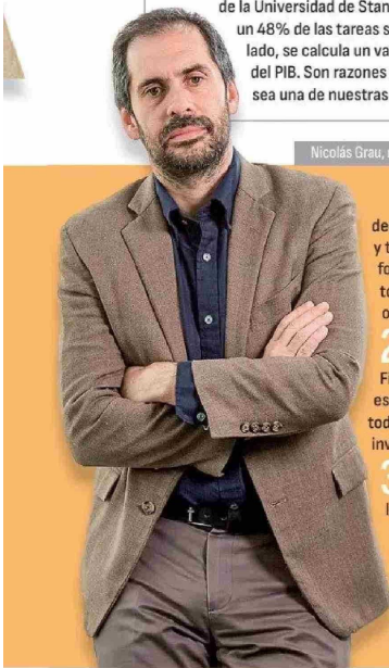
Nicolás Grau, ministro de Economía, Fomento y Turismo.

declaraciones juradas, silencios administrativos, procedimientos y tramitación en paralelo, ámbito de aplicación de la ley marco, fortalecimiento institucional, mecanismos de mejora regulatoria, interoperabilidad y digitalización, artículos transitorios y otros compromisos.