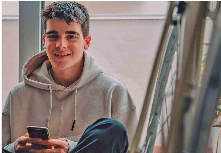
El osteosarcoma afecta, en su mayoría, a adolescentes y adultos jóvenes. También puede presentarse alrededor de los 65 años.

El osteosarcoma es un cáncer muy poco común y generalmente no se asocia a hábitos que puedan modificarse para prevenir su desarrollo. También suele detectarse en etapas avanzadas, lo que implica un gran reto para su manejo y tratamiento.