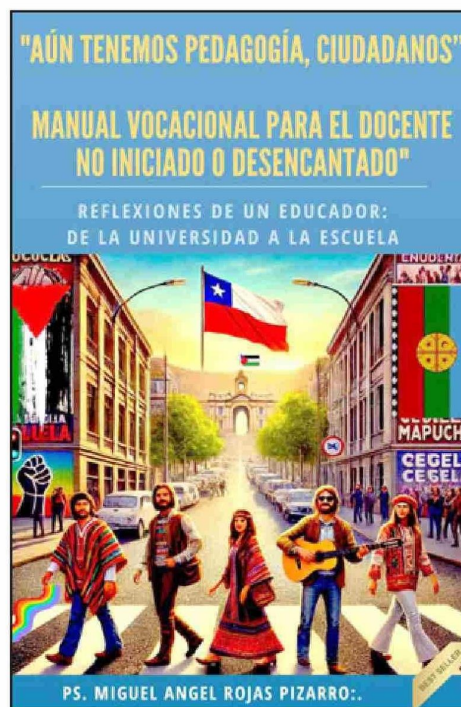
La portada sobre el nuevo libro de vocación docente.